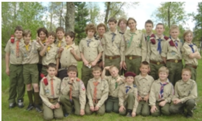
Uczestnicy biwaku hufca "Warta" w ośrodku harcerskim

Hufiec "Warta" rozpoczął już tegoroczną akcję letnią 3-dniowym biwakiem w ośrodku harcerskim Camp Norwid. 23 młodych harcerzy (rozdzieleni na 5 zastępów) zjechało się od 23-26 maja do naszego leśnego Ośrodka w północnym Wisconsin. Kierownictwo biwaku przygotowało ciekawe konkursy pomiędzy zastępami, grę terenową, olimpiadę, całodzienną pieszą wycieczkę, oraz mecz piłki nożnej.